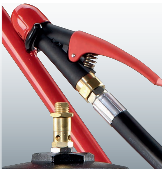
Dreh- und abstellbare Löschpistole