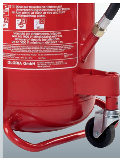
Lenkrolle und Standbügel